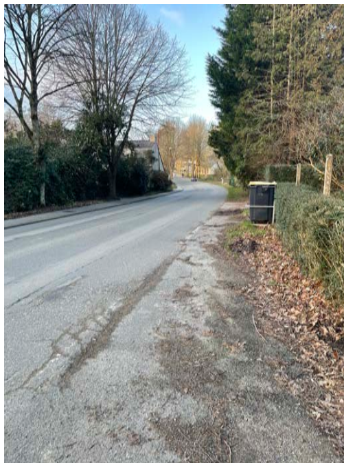
La courbe du Merrien

Du Merrien jusqu'à l'Ellipse puis vers le bourg, l'ambiance évolue nettement. Côté ouest, un alignement d'arbres de qualité structure la perspective d'entrée dans le centre jusqu'à l'Ellipse. Côté est, quelques sujets sont présents dans une ambiance végétale jusqu'au cabinet de kinésithérapie. Par la suite, la séquence est beaucoup plus urbaine et alterne entre murs en pierre ou façades des bâtis ce qui contribue à la transition progressive vers l'ambiance de centre-bourg. Quelques sujets arborés ponctuent ce linéaire, notamment le long de la résidence Saint-Roch. Sur ce tronçon, un arbre est destiné à être supprimé dans le projet. Ce point sera précisé dans la description des travaux.