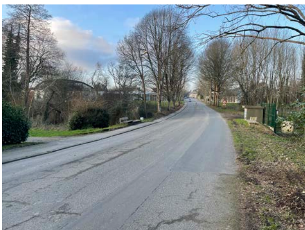
La courbe du Merrien et ses alignements d'arbres