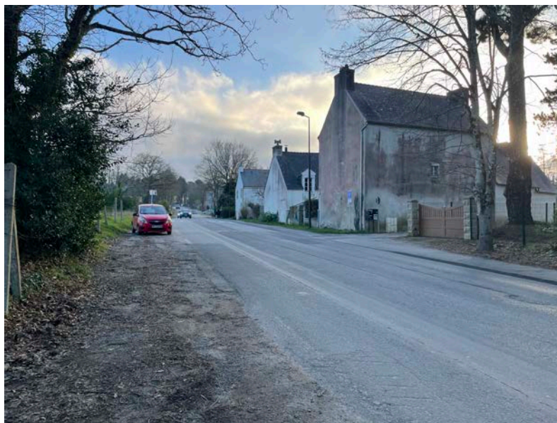
La limite actuelle non définie avec le nouveau lotissement Prat Bern à l'Est (photo à gauche) L'alternance pignon - clôture - végétation qui rythme l'axe à l'Ouest (photo à droite)

La traversée du Merrien constitue un point singulier : un pont en pierre étroit, peu valorisé, où seule une faible ouverture visuelle permet d'appréhender la vallée, un banc en mauvais état marque le lieu, ainsi que la présence d'un poste de transformation au droit de l'accès voisin vers l'est. Un projet de cheminement le long du Merrien est par ailleurs à l'étude, auquel les futurs aménagements devront pouvoir se raccorder.