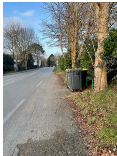
Les arrêts de bus rue des Acacias et au Nord de la MLC