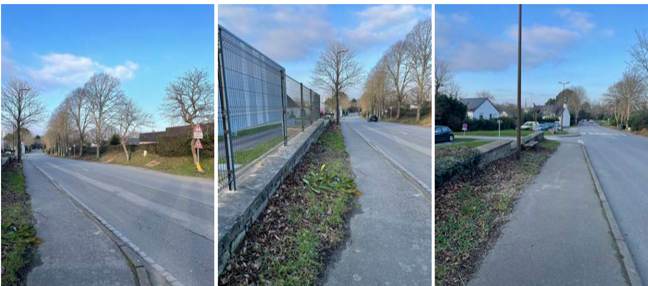
L'alignement d'arbres sur talus à l'Est / La clôture de l'entreprise Trivium à l'Ouest / Le mur en pierre et son espace enherbé devant la MLC

Plus au nord, entre la rue des Acacias et la MLC, les deux rives de la rue se distinguent également : un alignement sur talus accompagne le côté est (assurant la transition avec les constructions pavillonnaires en second plan), tandis que le côté ouest présente successivement un muret et des clôtures le long de Trivium, puis un muret en pierre marquant la place située devant la MLC, assorti d'arbres et d'un espace enherbé en second plan.