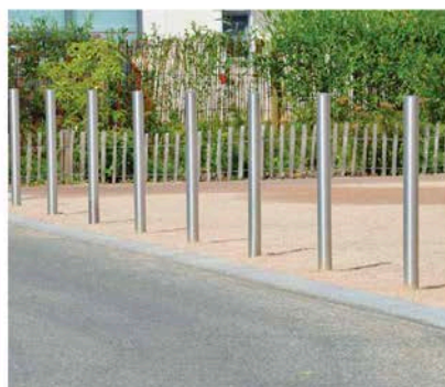
Potelet type PHENIX de chez AREA modèle DN70 qualité marine