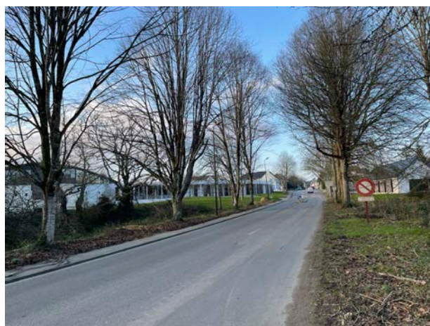
L'alignement qualitatif côté Ouest et Est qui marquent l'amorce vers le bourg