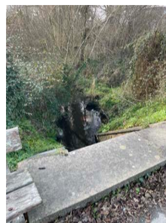
Le pont du Merrien côté Est avec son poste de transformation, sa haute clôture et son muret en pierre (à gauche) Le banc accolé au muret côté Ouest qui marque le lieu... (photo centrale) Le Merrien en contrebas du pont, aujourd'hui peu mis en valeur (photo à droite)