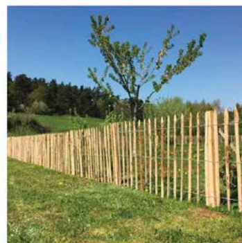
Ganivelle bois 1m de hauteur (+grimpantes)