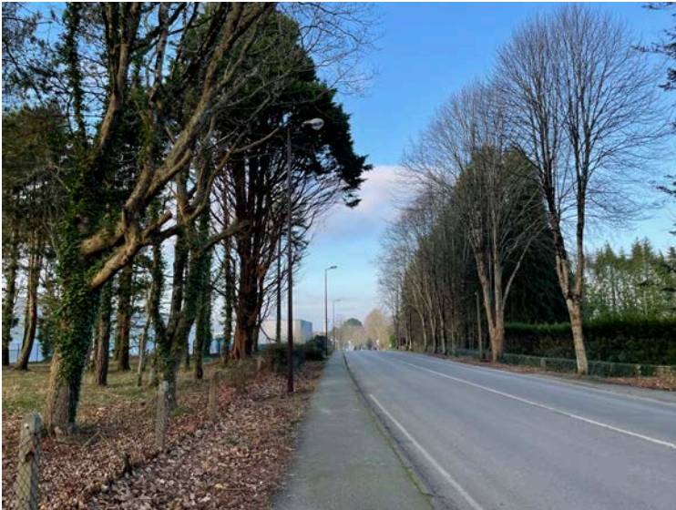
L'alignement d'arbres côté Est valorise l'entrée de ville, contrairement à la clôture de Trivium côté Ouest

Au sud, la rue est marquée par un alignement d'arbres côté est, depuis le giratoire jusqu'à la rue des Acacias. Côté ouest, la présence de la clôture de l'entreprise Trivium constitue un élément visuellement dominant, même si l'arrière-parcelle est largement plantée d'arbres imposants.