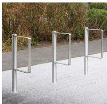
Appui-vélos type Phénix de chez Area

Les mobiliers du réaménagement de la rue Pont Ar Laer