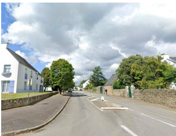
Les murs en pierre et façades bâties qui rythment l'axe entre la rue Orvoen et la place Lindenfels