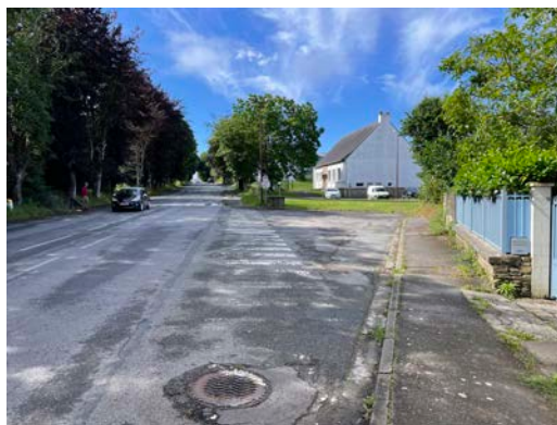
Le stationnement devant la résidence Saint-Roch / Le stationnement informel sur la « placette » triangulaire