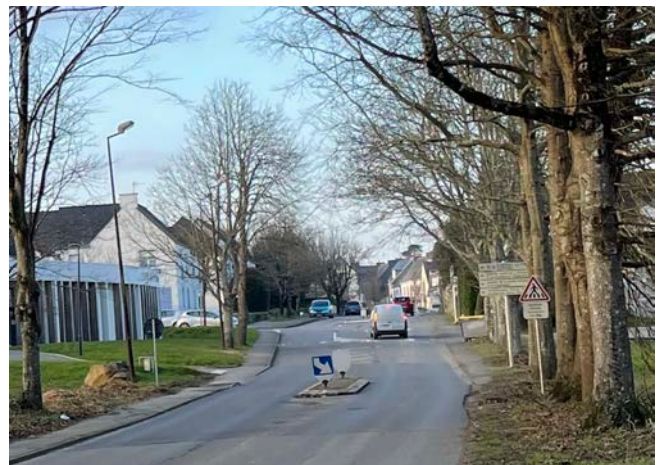
Les trottoirs étroits et discontinus à l'Ouest et accotements à l'Est / Trottoir de part et d'autre de l'axe à l'Ellipse

Le stationnement est ponctuel et souvent informel, notamment au droit du nouveau lotissement où plusieurs véhicules se stationnent anarchiquement sur le bas-côté. Quelques places sont également présentes au Nord de la MLC, sur la placette triangulaire en enrobé et d'autres au droit de la résidence Saint-Roch, au nord de la rue Orvoen).