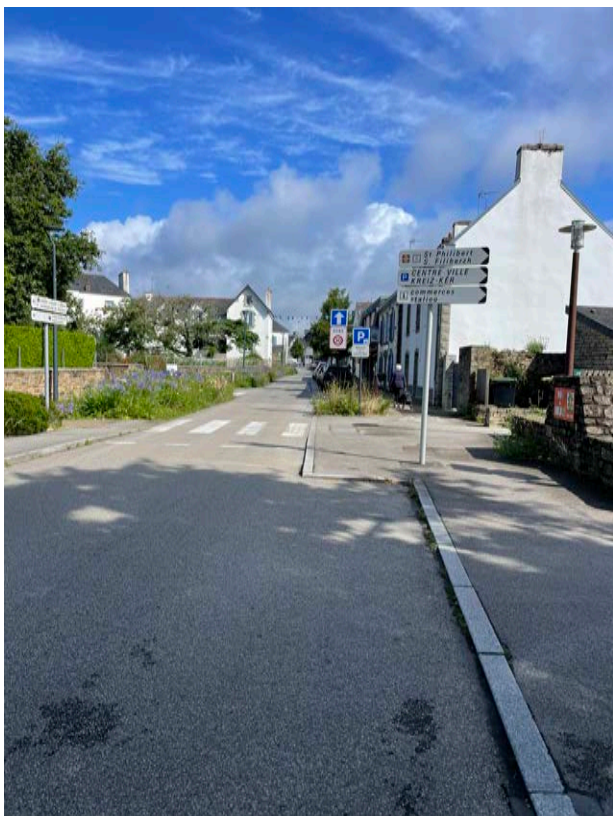
La rue Pont Ar Laer Nord, tronçon déjà réaménagé

Cet axe assure une transition progressive vers le centre-bourg. Au sud, l'ambiance est plus routière et liée aux activités (Trivium et la caserne des Pompiers), alors qu'au nord, les murs en pierre, les alignements d'arbres et la densification progressive des façades marquent l'entrée dans le bourg. À noter que le tronçon nord déjà requalifié fonctionne actuellement en sens unique montant. Une expérimentation est en cours pour envisager une inversion de sens afin de faciliter l'accès direct aux parkings du centre depuis la rue des Écoles.